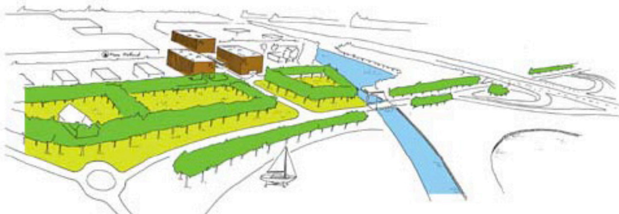
Industrieel landgoed - schets